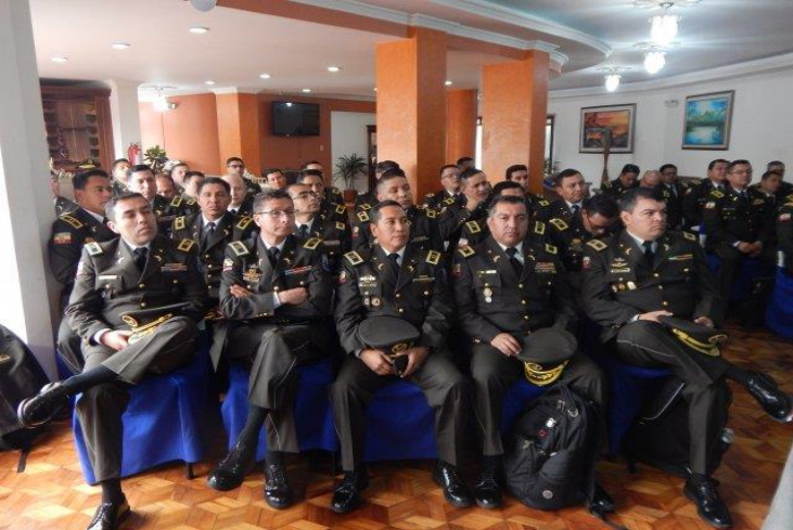
• INAGURACIÓN CURSO XLV E.M.