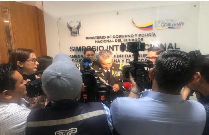
• SIMPOSIO 2020 QUITO-GYQL-CUENCA