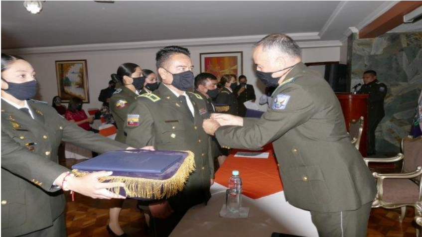
• CEREMONIA DE GRADUACIÓN. XLV